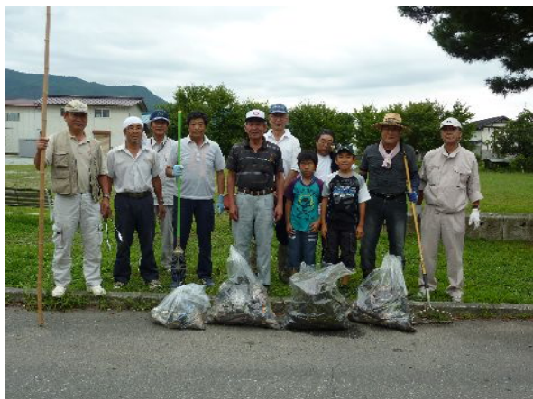
堀の清掃活動 回収したゴミを前に