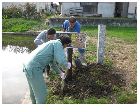
「新長瀬十景」看板設置