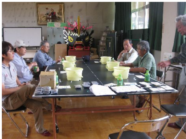
「身近な川や水辺の健康診断」パックテスト

約 400 年前に造られたと言われている長瀬陣屋跡の二の堀は長瀬地区のシンボルです。この貴重な水空間の環境保全・改善活動をしています。また、協働のまちづくりを進める東根市において、モデル事業となった「おらだな広場」作りにも主体的役割を果たし、地域おこし運動にも積極的に協力し活動しています。