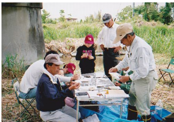
「身近な川や水辺の健康診断」パックテスト

村山高瀬川にはサケが遡上し、自然産卵しふ化、稚魚となり降海し、北洋で成長し回帰します。サケを育てるすばらしい環境を備えている高瀬川、この環境を保全する活動を続けています。