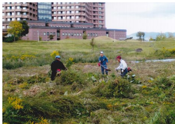
美化作業「健康の森公園」五春橋付近の草刈り