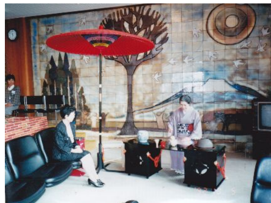
べにばな国体にて ボクシング競技の全国役員、選手に連日にわたるお薄茶の接待のようす