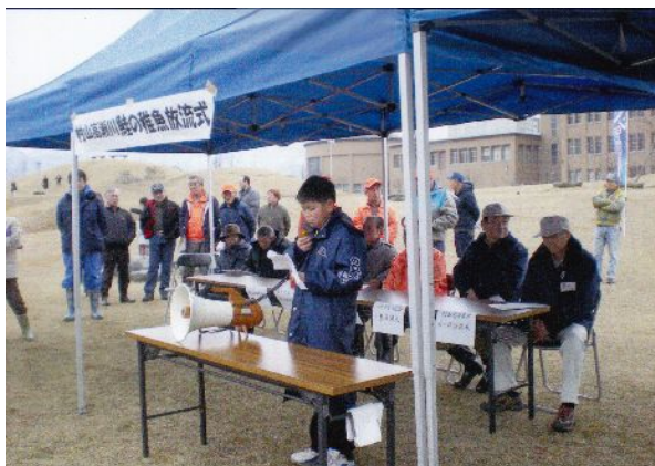
鮭の稚魚放流式 小学生代表あいさつ