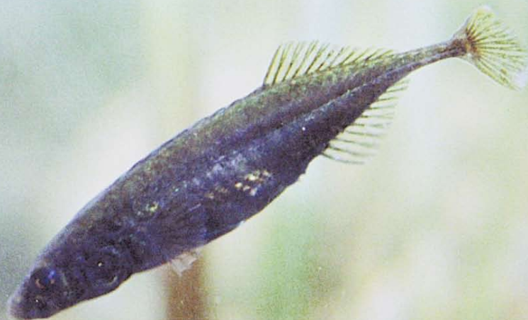
イバラトミヨの雄と雌(新庄市:指首野川)

家庭からの生活排水をきれいにして自然に戻すのが浄化槽です。浄化槽の約8割を占めている家庭用浄化槽は各家庭に管理責任があります。浄化槽法では、浄化槽の所有者などを「浄化槽管理者」と定め、