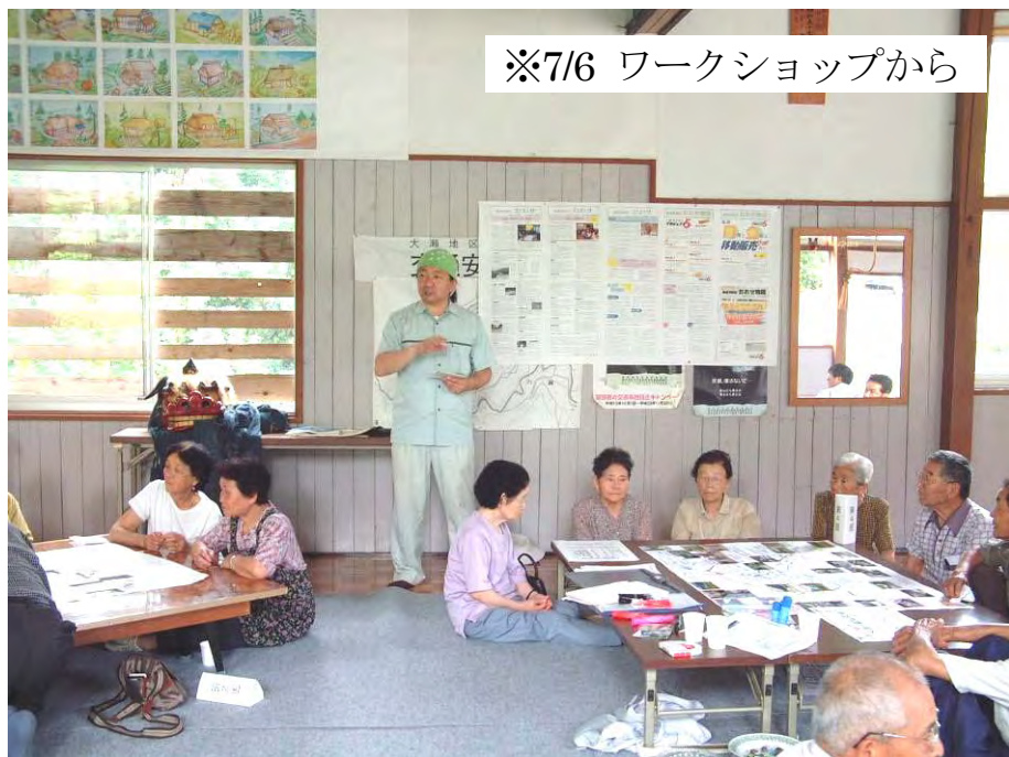
※7/6 ワークショップから

平成20年度、大瀬では地域の状況を点検し、地域の未来をみんなで考えていくことを目的に「大瀬の未来展望プロジェクト」に取り組んでまいりました。